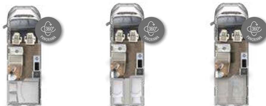
V 595 HB